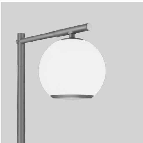
● Antracitgrå RAL 9023 Fine texture