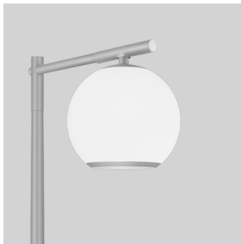
● Aluminiumgrå RAL 9006 fine texture