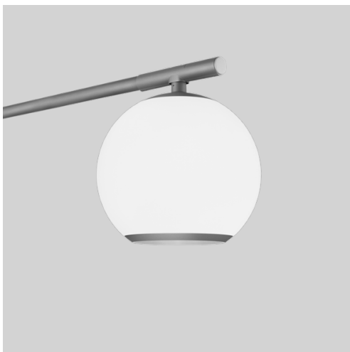
● Antracitgrå RAL 9023 Fine texture