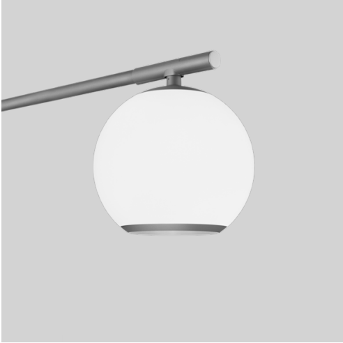
● Antracitgrå RAL 9023 Fine texture