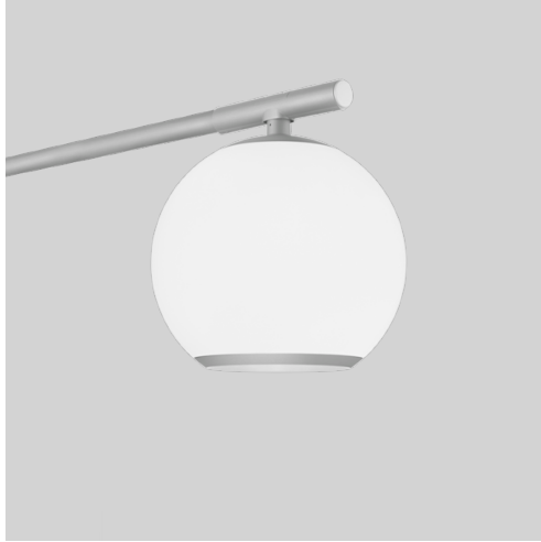
● Aluminiumgrå RAL 9006 fine texture