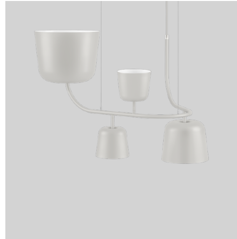
● Ljusgrå RAL 7035