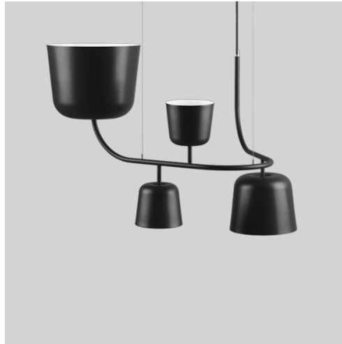
● Svart RAL 9005