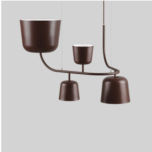
● Rödbrun RAL8017